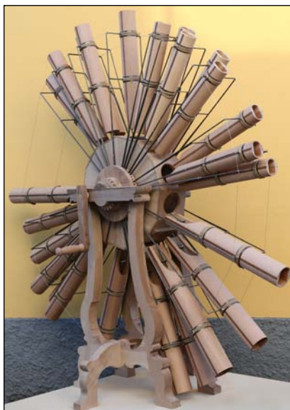
Il modello fisico del Can(n)one Musicale, presentato in anteprima mondiale il 26 febbraio 2014 a Milano