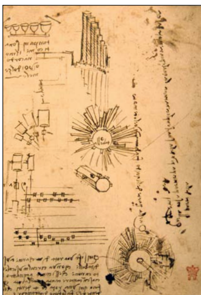
Il foglio 136r del Codice Arundel contenente il disegno originale di Leonardo del Can(n)one Musicale