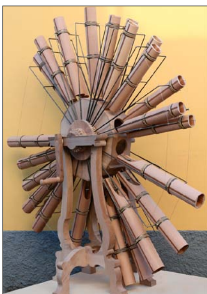
Ricostruzione del Can(n)one Musicale

Tra le tante novità aggiunte alla mostra va citato il Can(n)one Musicale , un vero e proprio strumento musicale programmabile perfettamente funzionante.