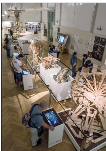
Panoramica di una sala della mostra

Un apprezzamento internazionale dovuto anche alla disponibilità di ottime audioguide in inglese, francese, tedesco, russo, portoghese, spagnolo e cinese.