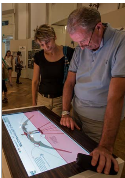
Una stazione multimediale L3