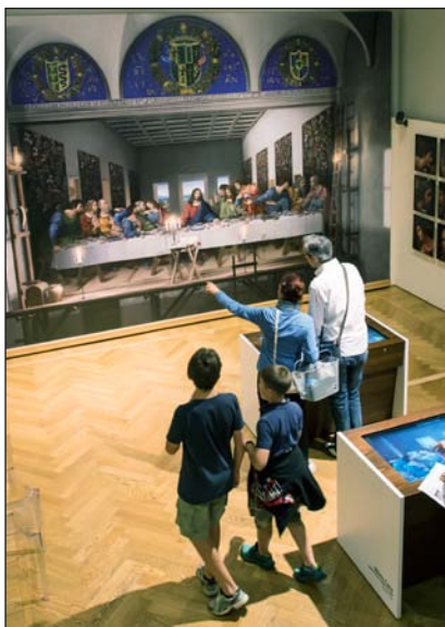
Il restauro digitale dell'Ultima Cena