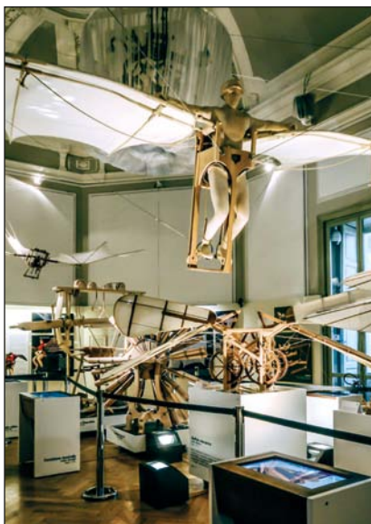
La Macchina Volante di Milano e altri modelli