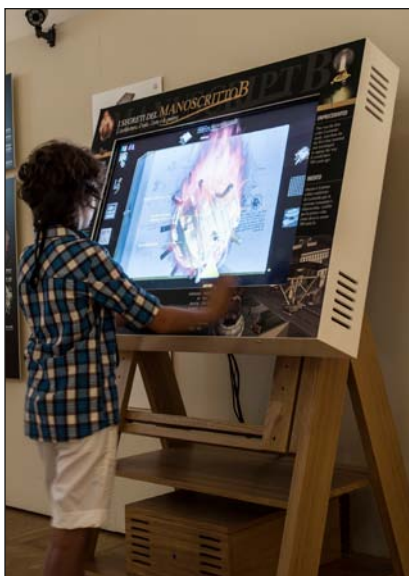
Il Manoscritto delle Meraviglie