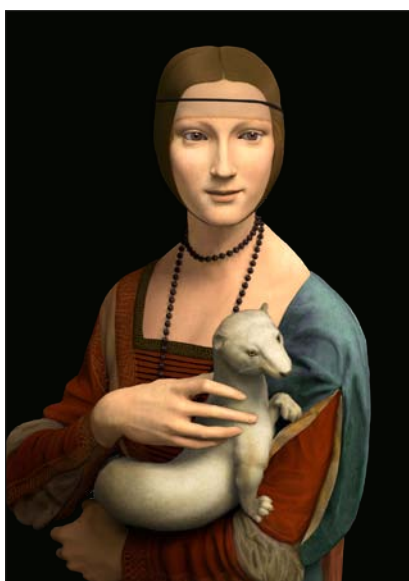
La Dama ricostruita in 3D