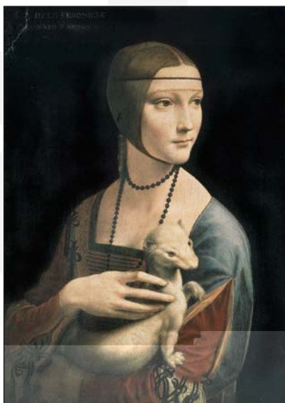
La Dama con l'ermellino conservata a Cracovia

Il ritratto propone un'iconografia di grande interesse e originalità. Cecilia Gallerani non è ritratta né frontalmente né di profilo come nella tradizione ritrattistica dell'epoca, ma leggermente di tre quarti, con il viso e lo sguardo protesi verso destra, introducendo movimento e azione in un genere pittorico solitamente statico e privo di elementi narrativi. Il ritratto non si limita alla semplice documentazione dei lineamenti della giovane, ma sembra narrare un episodio. Osservando la donna si può immaginare l'istante prima di quello ritratto, mentre