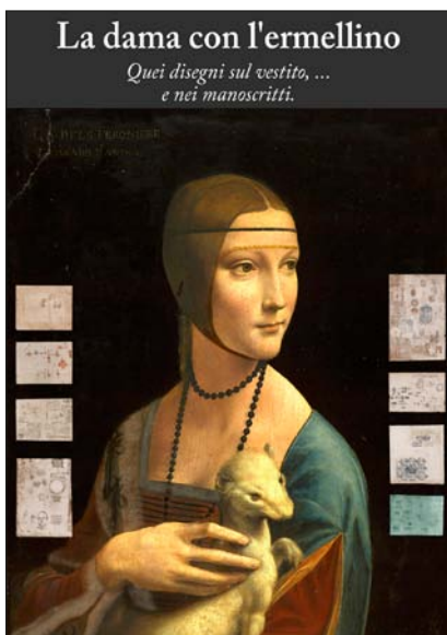
Una parte dell'esperienza è dedicata alla ricerca delle decorazioni del vestito all'interno dei manoscritti

Cecilia è ancora rivolta verso Leonardo, con l'ermellino tranquillamente adagiato sul braccio. All'improvviso accade qualcosa: l'animale si solleva nervoso e Cecilia si volta mentre con la mano trattiene delicatamente l'ermellino, il cui scatto viene descritto minuziosamente da Leonardo attraverso una resa anatomica molto dettagliata. La virtuosa tecnica artistica di Leonardo è così in grado di regalarci uno stupefacente scorcio sulla vita di corte milanese degli ultimi decenni del XV secolo.