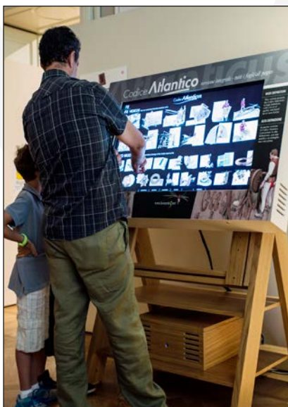
Il Codice Atlantico in versione integrale

Giochi Olimpici di Atene (2004); Italian Beauty Day ad Expo Shanghai Padiglione Italia (2010); Maria Callas Milano e Profumi d'Italia all'Italian Festival Weeks di Dubai (2011); Valentina Cortese. Uno stile a Palazzo Morando a Milano (2013); L'Orto della Bellezza Italiana a Expo Milano (2015).