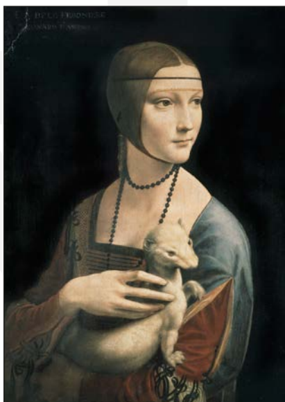
La Dama con l'ermellino conservata a Cracovia

Il visitatore entra nell'opera grazie alla ricostruzione di profumi e odori dell'epoca