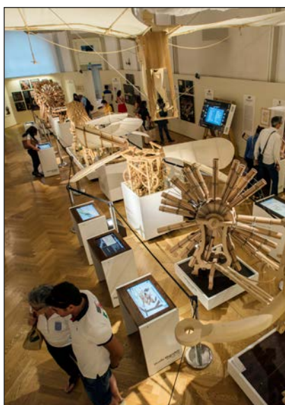
Panoramica di una sala della mostra