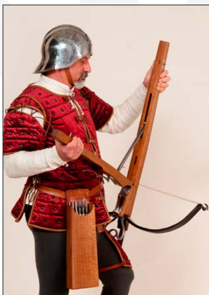
La Balestra Veloce

Leonardo da Vinci in formato digitale e interagire con le sue invenzioni attraverso modalità inedite e coinvolgenti, alcune destinate espressamente ai più piccoli, come Il Laboratorio di Leonardo – che consente di assemblare le invenzioni leonardesche e stampare il proprio certificato di inventore – e il Ponte Autoportante da assemblare fisicamente a partire dagli elementi lignei.