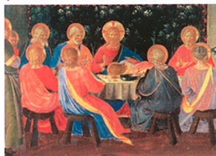
SOTTO, DA SINISTRA, L'ULTIMA CENA DEL BEATO ANGELICO E QUELLA DEL GHIRLANDAIO (PARTICOLARI). IN ENTRAMBI I DIPINTI, LA FIGURA DI GIOVANNI È PROTESA VERSO GESÙ. QUELLA DI GIUDA È POSTA DALL'ALTRA PARTE DEL TAVOLO E I DISCEPOLI HANNO LE AUREOLE

«Be', glielo dico io, si fidi. Mancano non perché siano sparite per il deterioramento del muro, ma perché Leonardo non le ha mai dipinte. E sa perché?».